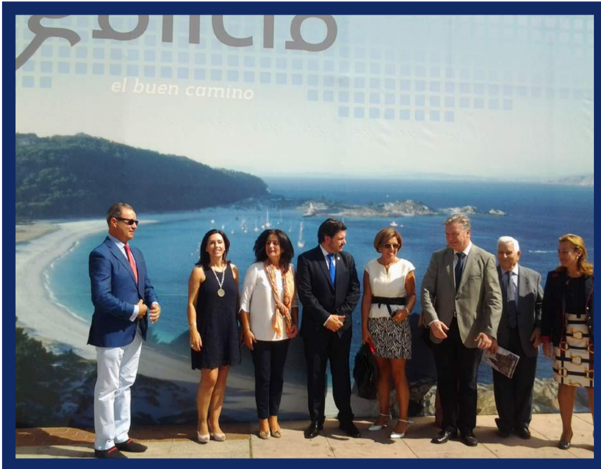
Autoridades cordobesas y gallegas. Inauguración de la carpa