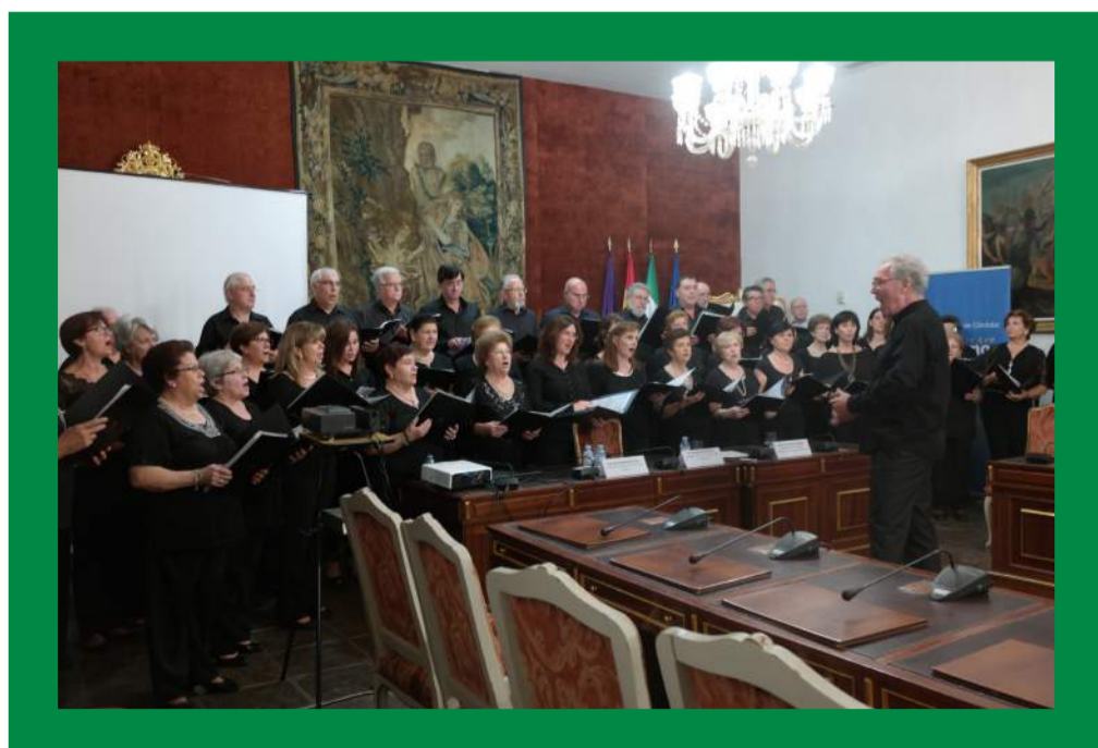
Actuación Coro Martín Códax

A continuación actuó allí mismo el Coro Martín Códax de la Casa de Galicia que interpretó diversas canciones gallegas.