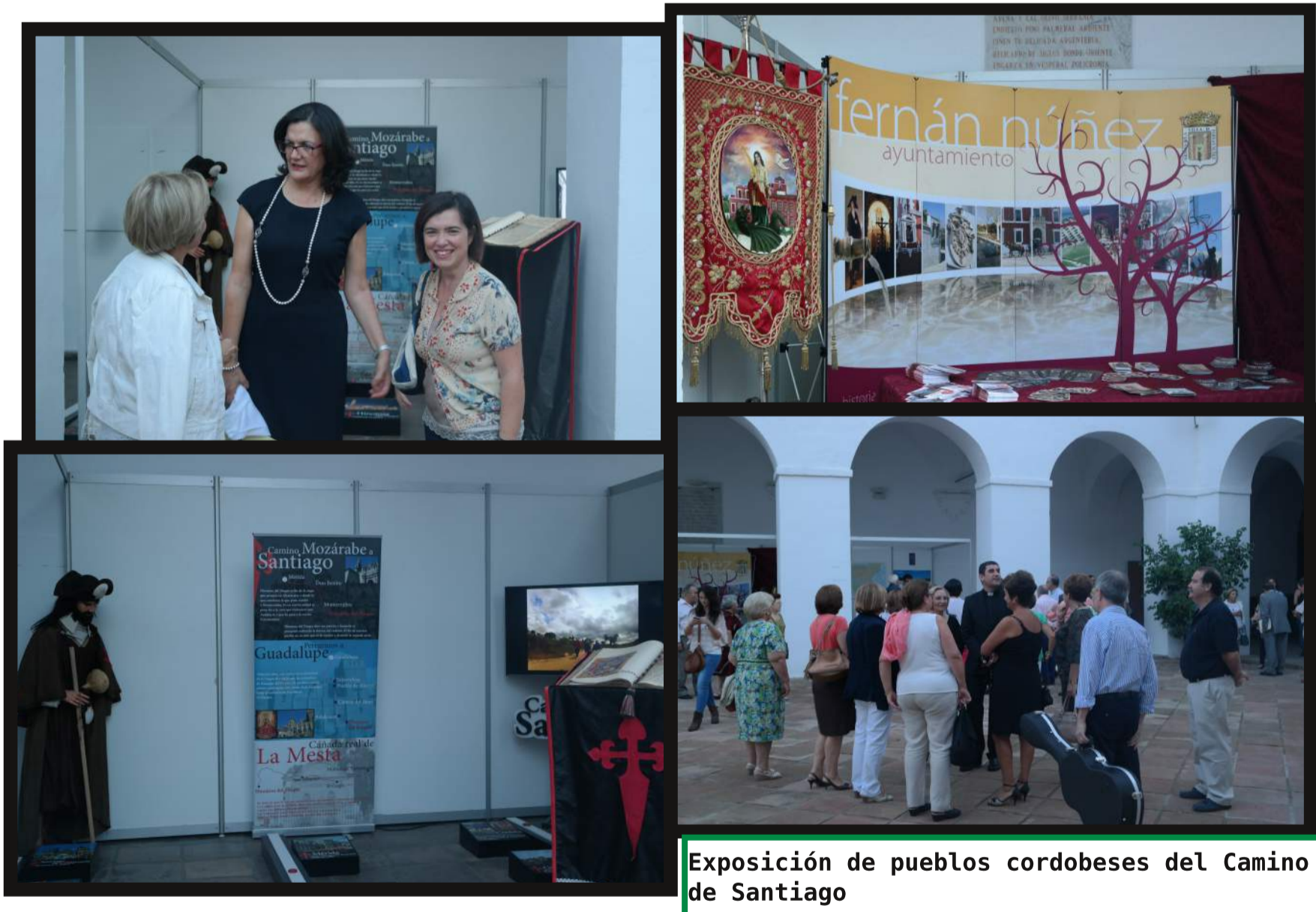
Exposición de pueblos cordobeses del Camino de Santiago

Un cuarto stand de Fernán Núñez, unido a Galicia por su Patrona.